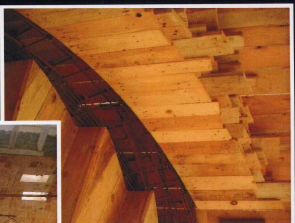
villa LEGGIERO Monopoli